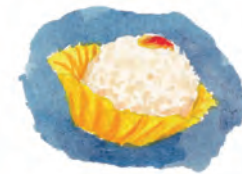
Orez lipicios la abur cu fasole roșie