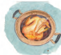
Rață cu ghimbir