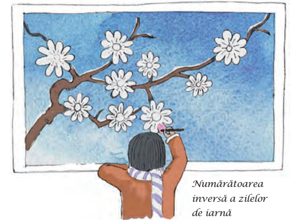
Numărătoarea inversă a zilelor de iarnă

Strămoșii chinezilor au conceput o metodă prin care își puteau da seama când urma tranziția de la iarnă la primăvară. Ei desenau nouă flori de prun, fiecare cu nouă petale, iar după Solstițiul de iarnă colorau câte o petală în fiecare zi. Când toate cele nouă petale ale celor nouă flori erau colorate, iarna trebuia să se termine.