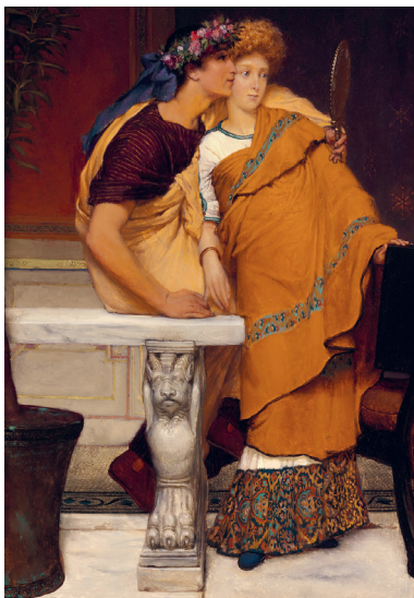
Lawrence Alma-Tadema, Oglinda , ulei pe pânză, 1868