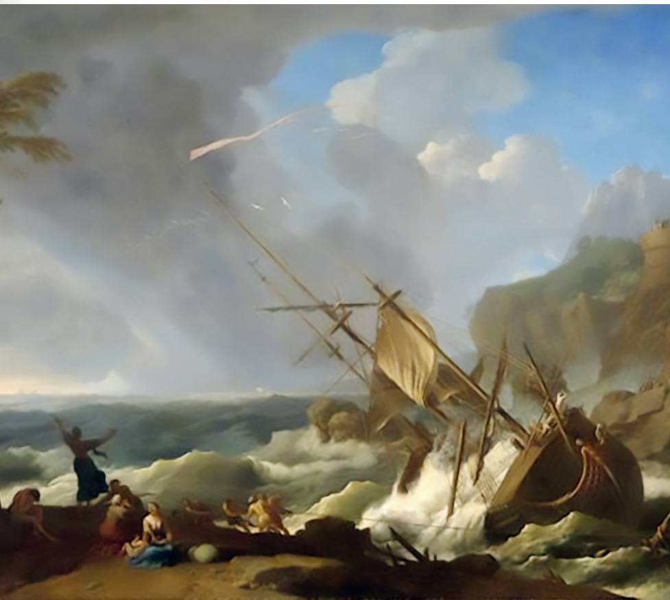
Adrien Manglard, Naufraziul , 1715