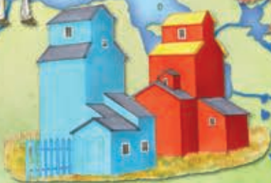
Silozuri pentru cereale