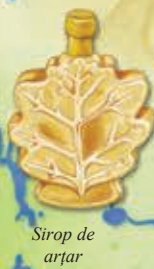
Sirop de arțar