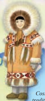
Costum tradițional inuit